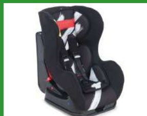
Автокресло группы I для детей массой 9-18 кг