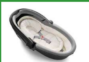
Автокресло «люлька» группы 0 для детей массой менее 10 кг

Детские удерживающие устройства подразделяют на 5 весовых групп: