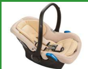
Автокресло группы 0+ для детей массой менее 13 кг