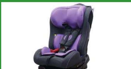
Автокресло группы II для детей массой 15-25 кг