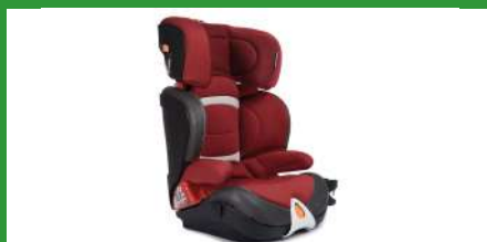
Автокресло группы III для детей массой 22-36 кг (возможно использование бустера)